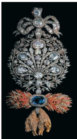
Insígnia da Ordem do Tosão de Ouro

Não posso deixar de dar destaque à Insígnia do Tosão de Ouro, apresentada ao público na exposição Ouros do Brasil no Palácio Nacional da Ajuda , em 1986, em que o público podia ver a peça dos dois lados. O tamanho da jóia – vinte e oito centímetros de comprimento – a leveza e beleza que a envolvem são indiscutíveis.