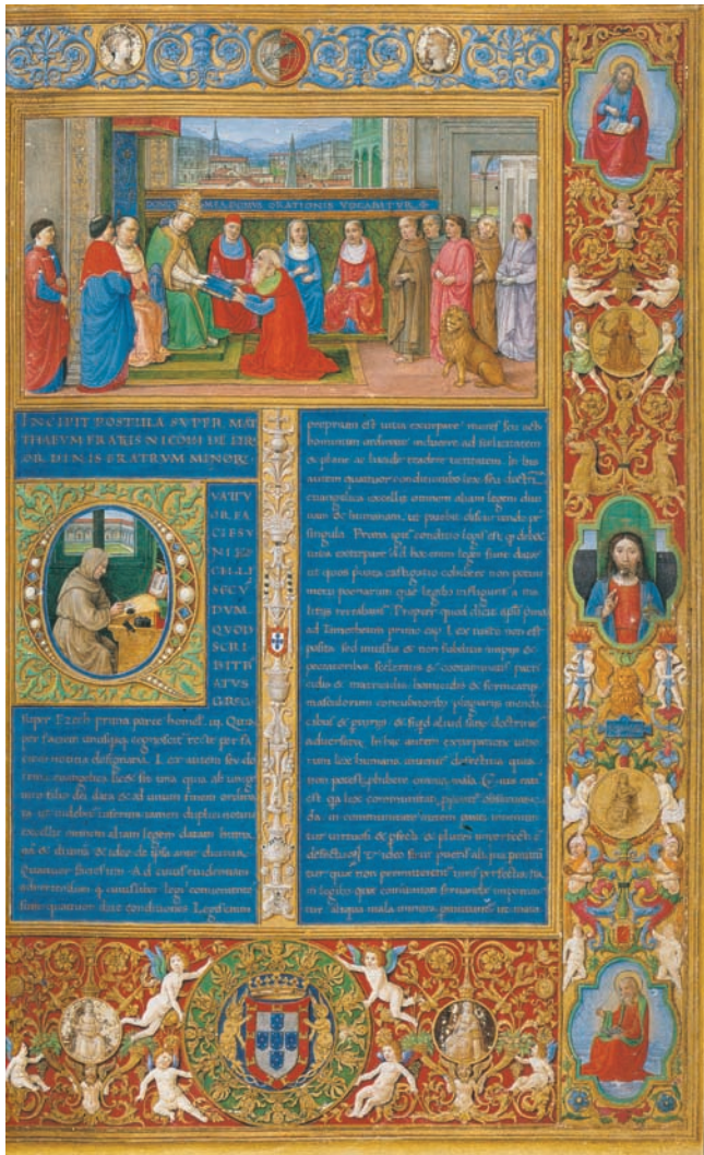
Página da direita do duplo frontispício do volume VI da Bíblia dos Jerónimos (finais do séc. XV). ANTT.

No ocidente europeu, a matéria-prima mais usada na preparação do pergaminho foi a pele de cabrito ou de cordeiro. Na elaboração de livros ou documentos particularmente importantes utilizavam-se peles muito finas e delicadas, obtidas geralmente a partir de fetos de vaca, de cabra ou de ovelha – era o velino , um pergaminho macio, branco, quase transparente. Os sete volumes da Bíblia dos Jerónimos , por exemplo, são todos em velino. As bulas papais são também, quase sempre, em velino.