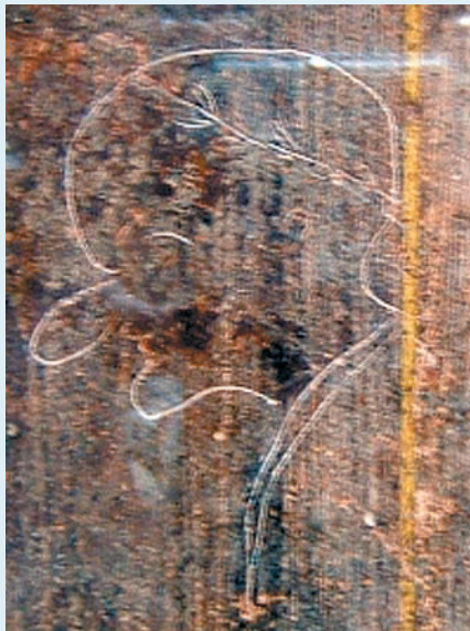
Graffito de Pompeia com a caricatura de um político