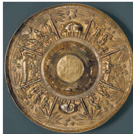
Salva com motivos africanos (séc. XVI)

Os portugueses sempre foram mestres prateiros de renome. As pratas manuelinas já referidas dão-nos o exemplo acabado da qualidade, beleza e execução primorosa. As viagens para o Novo Mundo também foram inspiração e as duas salvas de motivos africanos decoradas com fauna e flora de África, no prato e no pé, são exemplares únicos no mundo; são a imagem de marca da exploração portuguesa em África no século XVI. Todas as exposições que se organizam sobre este tema as solicitam, mas dada a sua raridade, é cada vez mais difícil serem emprestadas. A única vez que estiveram as duas peças numa exposição foi nos Tesouros Reais .