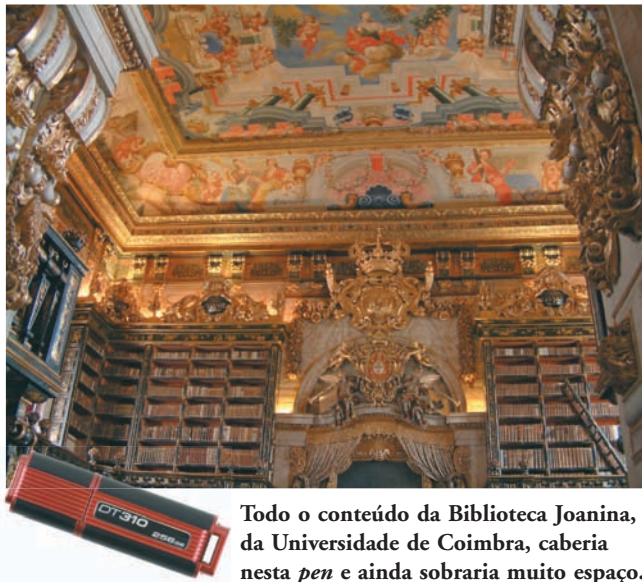
Todo o conteúdo da Biblioteca Joanina, da Universidade de Coimbra, caberia nesta pen e ainda sobraria muito espaço.

Já no final do século XIX surge o linótipo , a máquina de compor que alguns de nós ainda chegámos a conhecer. O offset , a quadricromia, a fotocomposição e as modernas técnicas informáticas de trabalho gráfico culminariam um progresso alucinante. Hoje são possíveis tiragens de centenas de milhares, ou mesmo de milhões de exemplares dos mais belos livros em tempo recorde, com uma qualidade gráfica inexcelável.