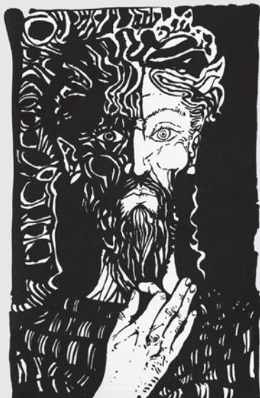
Gravura de Lima de Freitas (1984)

É o mais doloroso dos lixos, aquele a que se condenam os humanos – os rejeitados e os esquecidos, todos aqueles que vivem na miséria e na solidão extremas, ou que, desvinculados do tecido social,