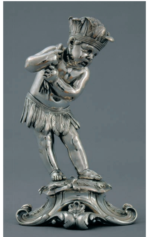
Peças da Baixela Saint Germain

se arrastou por vários anos, sem que a coroa portuguesa pudesse reaver o que lhe pertencia.