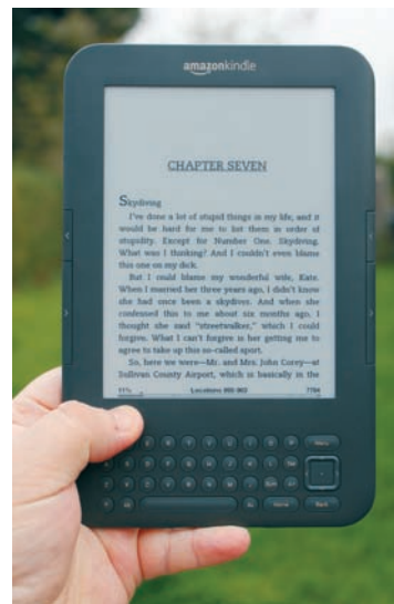
Leitor electrónico de livros ( e-book reader ).

Os livros e os jornais tornam-se electrónicos? Ganha-se e perde-se com isso. Haverá sempre quem prefira o acto solitário da leitura da palavra impressa, a visualização repetida de uma bela reprodução fotográfica, o sabor de uma metáfora poética que só o livro tradicional possibilita. E, depois, há o prazer do manuseamento do próprio