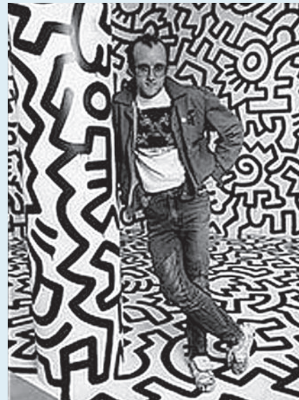
Keith Haring junto aos seus desenhos

associada a outras produções comerciais representativas da cultura americana como, por exemplo a Coca-Cola que ilustra, de um modo inequívoco, a nova mentalidade orientadora da cultura popular e do american way of life . Não é por acaso que Andy Warhol – artista Pop que começou por ser designer gráfico e publicitário – produziu inúmeras obras de homenagem à Coca-Cola.