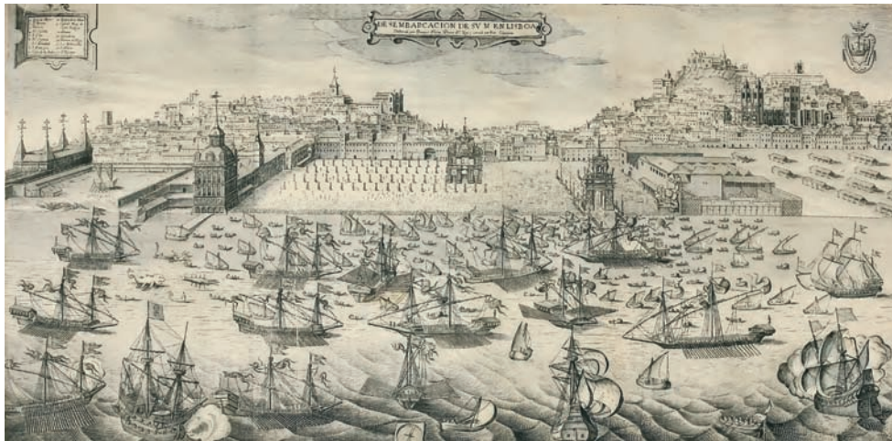
Desembarque de Filipe III, na praça do Paço em Lisboa, Domingos Vieira Serrão (desenho); Hans Schorkens (gravura). In Lavanha, 1662.

fulcral é a descrição do aparato decorativo das ruas para a recepção ao rei, muito em especial a arquitectura efémera e o seu significado alegórico” (Alves, c. 1986: 11).